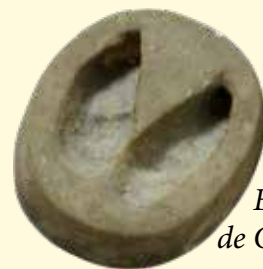
Empreinte de Cerf

Par tél. : 04 94 80 06 95 ou par mail : contact@fdc83.com .