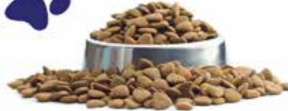
Entretien / High Perfo