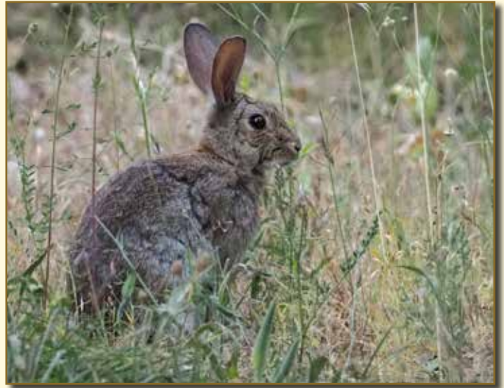
Lapin de garenne de Carcès