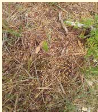
Une latrine, preuve de la colonisation du lapin !

Même si les résultats sont en cours d'analyse, on peut déjà en tirer quelques conclusions :