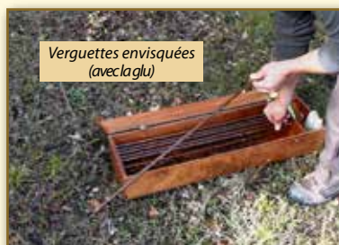
Verguettes envisquées (avec la glu)