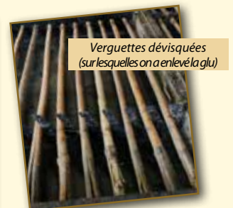
Verguettes dévisquées (sur lesquelles on a enlevé la glu)

Voilà un secret de fabrication jalousement gardé et bien gardé. Transmis uniquement oralement à quelques privilégiés, et point de copinage dans ce domaine.