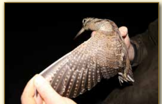
1 ère bécasse baguée dans le Var de la saison 2019

Les informations récoltées par le baguage sont extraites des seuls sites de baguage et de reprise et, en conséquence, le déroulement « au jour le jour » des migrations demeure en majeure partie inconnu. C'est le cas en particulier du trajet réel des oiseaux, du nombre de haltes migratoires, de leur durée et de la localisation des sites dédiés à ces haltes. La connaissance de ces éléments est désormais possible grâce aux balises Argos. Ces nouvelles technologies embarquées sont utilisées depuis quelques années pour suivre les animaux dans leurs déplacements. Les avancées en termes de miniaturisation permettent désormais d'équiper des oiseaux de la taille d'une bécasse, sans dépasser 5 % du poids de l'oiseau. De fréquentes localisations permettent de suivre leur trajet et d'améliorer nos connaissances sur les haltes migratoires. En France depuis 2015 plusieurs oiseaux ont été équipés, sur le site www.becassismigration.fr vous trouverez des informations concernant les bécasses équipées de balises Argos.