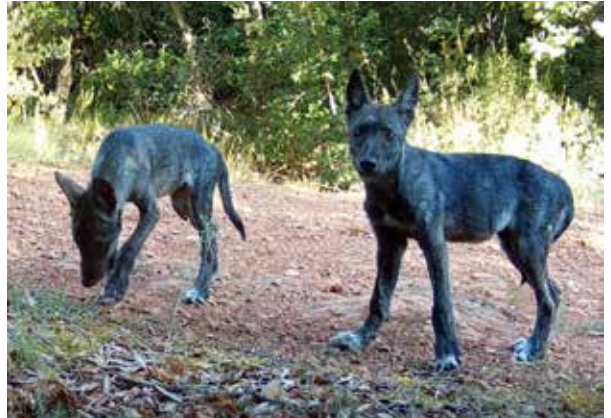
© PHILIBERT JN – FDC 83