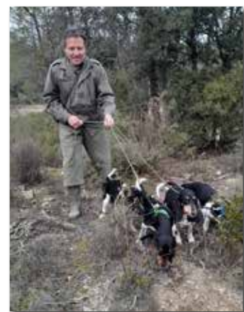
Des petits courants suisse