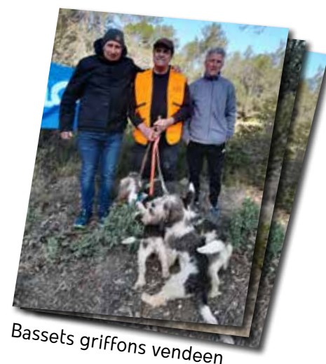
Basset griffons vendeen